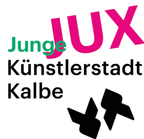
Bild des Monats

Galerie die 8, Alte Bahnhofstraße 8, Kalbe (Milde)